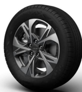
Wheel Design „Elite“