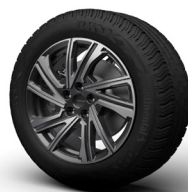
Wheel Design „Luxury“