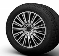
Wheel Design „Premium“